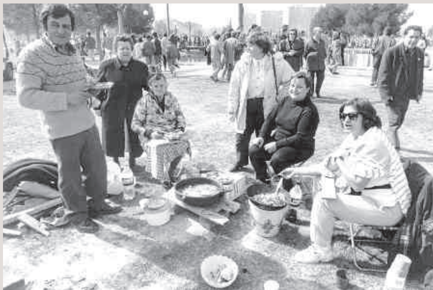
UNA FAMILIA CELEBRANDO EL 5 DE MARZO EN EL PARQUE DEL TÍO JORGE, EN 1992

Pero debemos ir al grano y saber separar cuidadosamente el trigo de la paja. La Cincomarzada no es bien vista por mucha gente y menos aún por los poderes políticos y económicos a los que cada año se les viene “sacando los colores” por su escaso interés en las causas más populares. Hay en esta fiesta mucha libertad, mucha reivindicación, mucho populacho para ser bien vista por el mundo bienpensante. Ojo al parche.