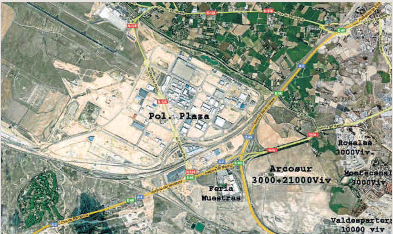
ARRIBA, MAPA SONORO DEL AEROPUERTO DE ZARAGOZA (DE 1999). SOBRE ESTAS LÍNEAS, VISTA AÉREA EN LA QUE SE APRECIAN LAS INSTALACIONES DEL AEROPUERTO, EN LA ZONA SUPERIOR IZQUIERDA.