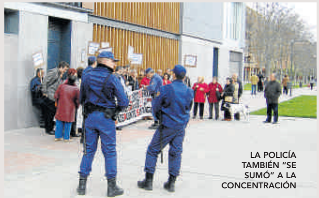
LA POLICÍA TAMBIÉN "SE SUMÓ" A LA CONCENTRACIÓN

Hemos necesitado de ocho piedras - inauguraciones virtuales para que lo terminaran de construir, ahora en marzo hace un año, y este invierno lo hemos tenido que pasar en la calle, viendo cómo los dineros para personal y mobiliario se iban para la Expo o para el Seminario. Creemos que es intolerable que un equipamiento tan demandado por los mayores lleve un año parado, cuando las obras ya terminaron. Señor alcalde: ¡¡CUMPLA!!