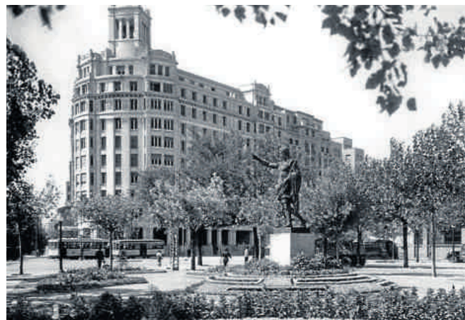
LA ESTATUA DE CESARAUGUSTO EN LA PLAZA PARAÍSO (AÑOS 70)

Habrás más y habrá que debatir la necesidad o no del cambio. No es fácil hacerlo, la Historia resulta a veces veleidosa, ya apuntamos cómo la Corporación Municipal que dio nombre a las calles a mediados