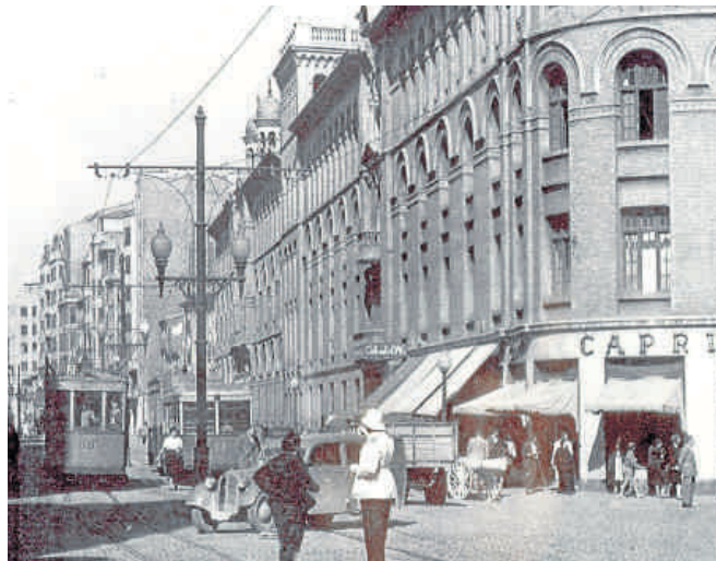
CONDE ARANDA CUANDO ERA GENERAL FRANCO (AÑOS 50)

O aquella historia que nos cuenta la calle Cortesías, próxima a la Magdalena, antiguamente una de las más estrechas de la ciudad, tanto, que al encontrarse de frente dos personas, debían ponerse de acuerdo, mediante reverencia de cortesía, sobre cuál de ellos debía pasar primero. La del Desengaño, próxima a la de Alfonso I, a través de la cual los desengañados abandonaban la casa de juego situada en el Coso y cuya fa-